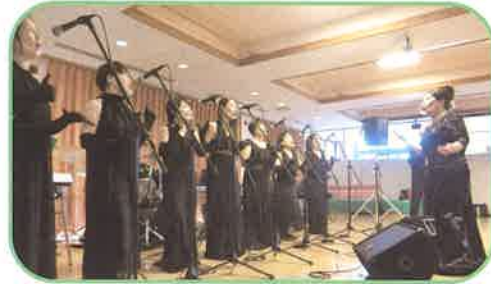
クリスマスコンサート